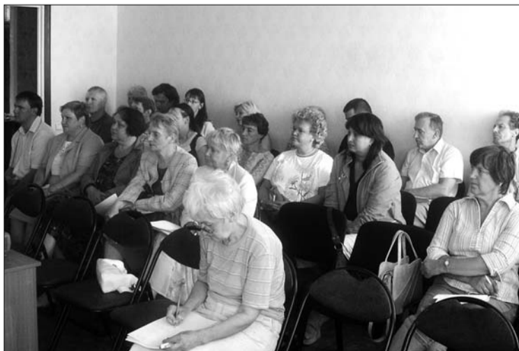
Semināra "Optimāla atkritumu saimniecība – no teorijas līdz praksei" klausītāji.