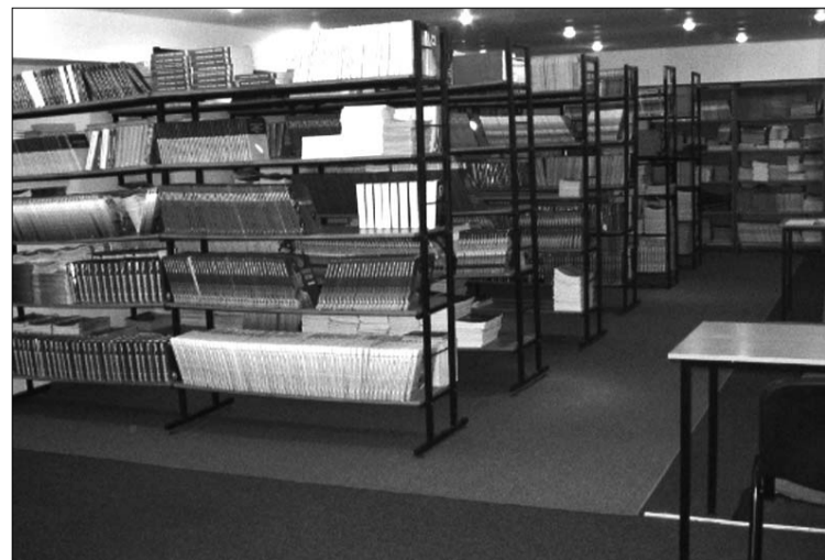
Новое, благоустроенное место для хранения и выдачи учебных материалов.