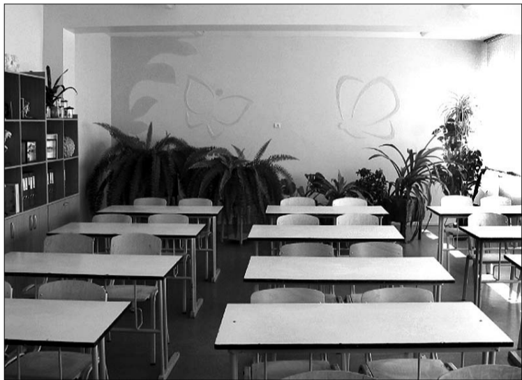
Olaines 2. vidusskolas izremontētais bioloģijas kabinets.