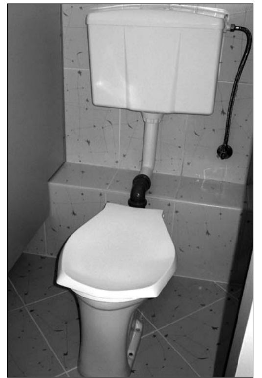
Higiēnas telpas Olaines pirmsskolas izglītības iestādē "Zīle".

LARISA KORNEJEVA, PIRMSSKOLAS IZGLĪTĪBAS IESTĀDES "ZĪLE" V. I.