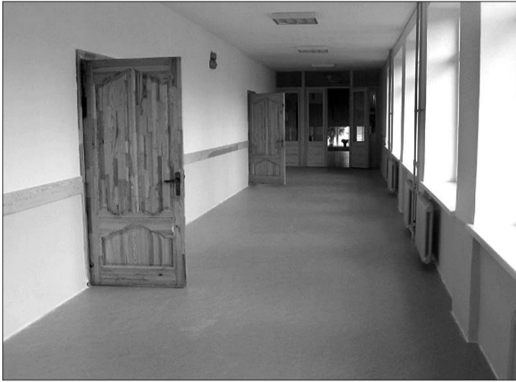
Kapitāli izremontēts pirmā stāva gaitenis Olaines 1. vidusskolā.

Šogad skolā nokomplektētas 30 klases, 1. klasē mācības divās paralēlklasēs uzsāka 55 skolēni, tāpat ir arī divas 10., divas 11. un divas 12. klases. Tiek veidota piecus līdz sešus gadus veco bērnu sagatavošanas grupa. Aicinām vecākus, kuru bērniem nav vietas pirmsskolas izglītības iestādēs, pieņemt savas pirmsskolas vecuma atvases sagatavošanas grupai skolā.