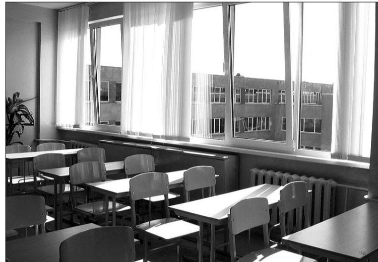
Новые окна в кабинетах на 3 этаже в Олайнской средней школе №2.

Олайнская средняя школа № 2 приглашает своих бывших и нынешних сотрудников на празднование 30 – го юбилея школы 20 октября 2006 года. Информация об участии по телефону 7963582.