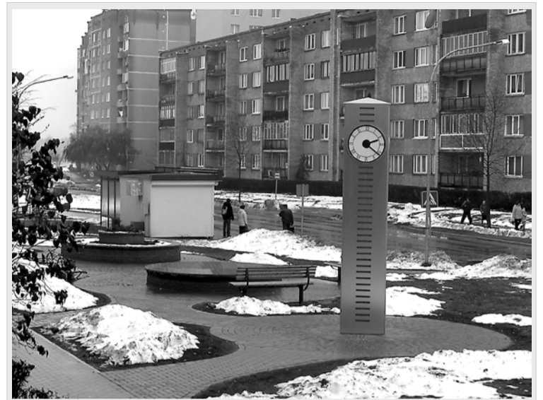
Pārmaiņu laikā un straujajā dzīves ritmā ir svarīgi plānot laiku un sekot tam. Olaines pilsētas centrā dome uzstādīja pulksteni. Ceram, ka tas mūsu iedzīvotājiem vienmēr rādīs viņiem pareizo laiku!

Olaines pilsētas dome pateicas LR 8. Saeimas Zaļo un Zemnieku savienības frakcijai par valsts budžeta līdzekļu piešķiršanu Ls 30 000 apmērā Olaines 1. vidusskolas piebūves izbūvei.