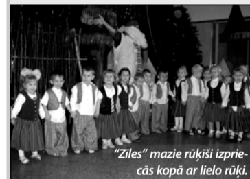
"Ziles" mazie rūķiši izpriecās kopā ar lielo rūķi.