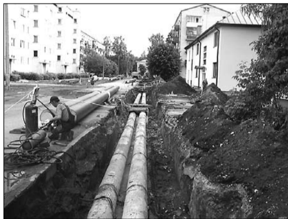
Vēl nerekonstruēts siltumapgādes sistēmas posms.

lu posmā no K-2-1 līdz K-2-13 (kopējais siltumtīklu garums 552 metri).