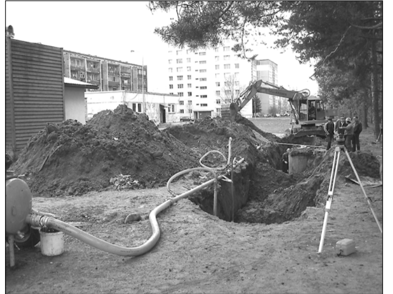
Projekta „Ūdenssaimniecības attīstība Olainē un Jaunolainē” Olaines komponentes īstenošanas darbi.

Lai gan pašlaik noslēgumam tuvojas ūdensvada un kanalizācijas tīkla nomaiņa Kūdras ielā,