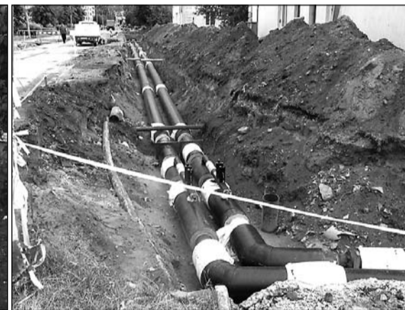
Cita siltumapgādes sistēmas posma rekonstrukcijas darbi.

balstu no Eiropas Reģionālās attīstības fonda (ERAF) projektam "Olaines pilsētas centralizētas siltumapgādes sistēmas rekonstrukcija".