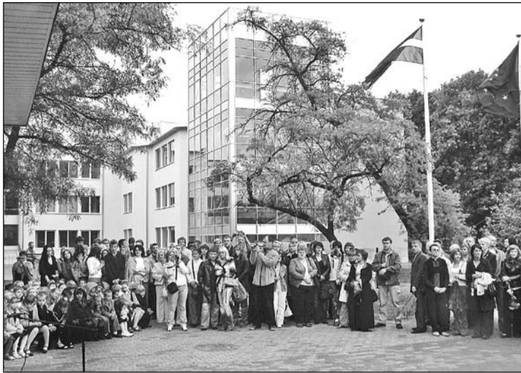
Olaines 1. vidusskolas piebūve.