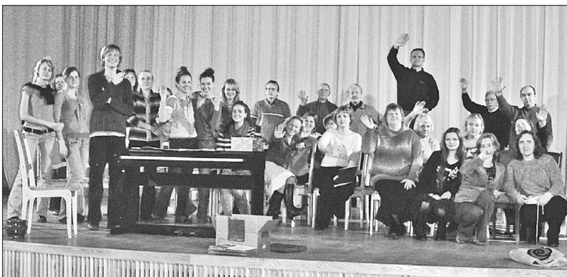
Koris "Dziesma" mēģinājumā 40 gadu jubilejas koncerta priekšvakarā.

Aizsteigusies vasara, pienācis rudens, un Olaines pilsētas jauktais koris "Dziesma" uzsācis savu 41. darba gadu.