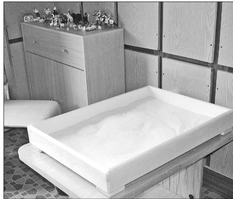
Olaines 2. vidusskolā tiek izmantota smilšu terapija.