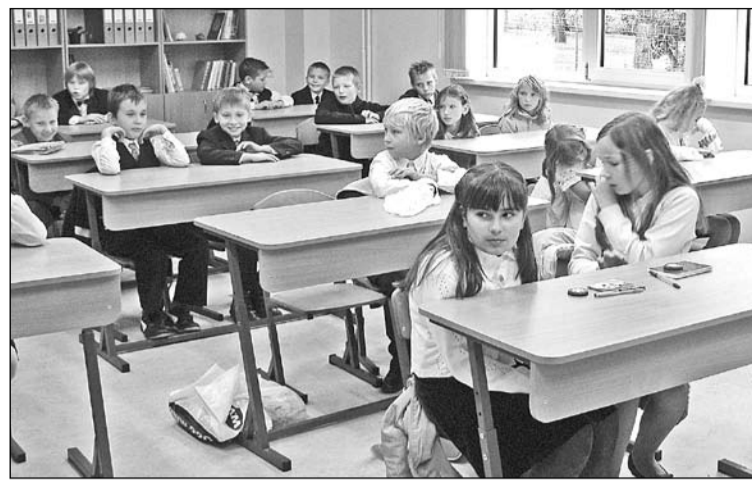
Olaines 1. vidusskolas 4. klases skolēni jaunajā skolas klasē.