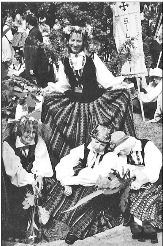
Ikviens korista lielākais sapnis – Dziesmu svētki.

ču mēs vienlaikus arī esam atvērti jaunajam, mēs vēlamies augt un attīstīties, darboties šodienai un nākotnei. Ja arī Tu, mīļo lasītāj, vēlies dziedāt, vēlies piedalīties dažādās kora aktivitātēs, tad Tev ir šī iespēja tepat – Olainē. Pievienojies mums!