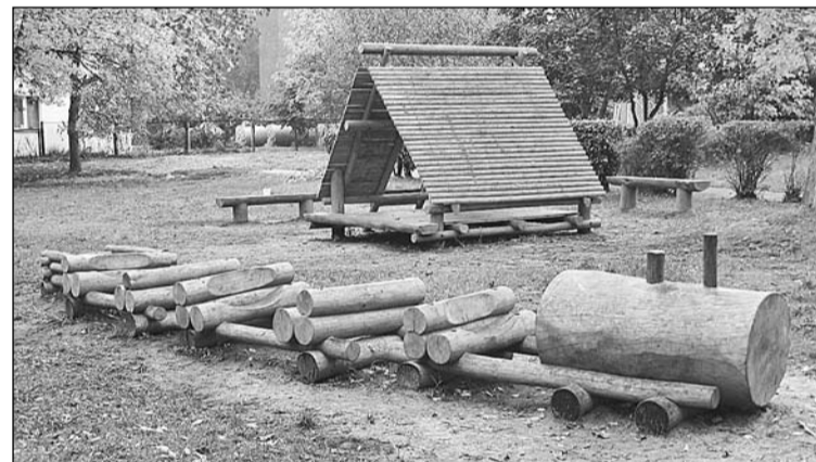
Daļa no rotaļu kompleksa OPPII "Dzērvenīte".

jomā: kanalizācijas cauruļu maiņa 4 stāvvados, ūdens cauruļu maiņa 8 stāvvados, divu grupas telpu kosmētiskais remonts ar grīdas seguma un apgaismojuma ķermeņu maiņu, bērnu rotaļu kompleksa uzstādīšana, teritorijas labiekārtošana – veco nojumiņu pamatņu demontāža, augsnes izlīdzināšana, veco krūmāju izciršana, izvešana, zālāja atjaunošana, 48 divstāvējo gultu kapitālais remonts ar 24 skapju koka apdares veikšanu, 48 matraču, spilvenu un cita mikstā inventāra iegāde.