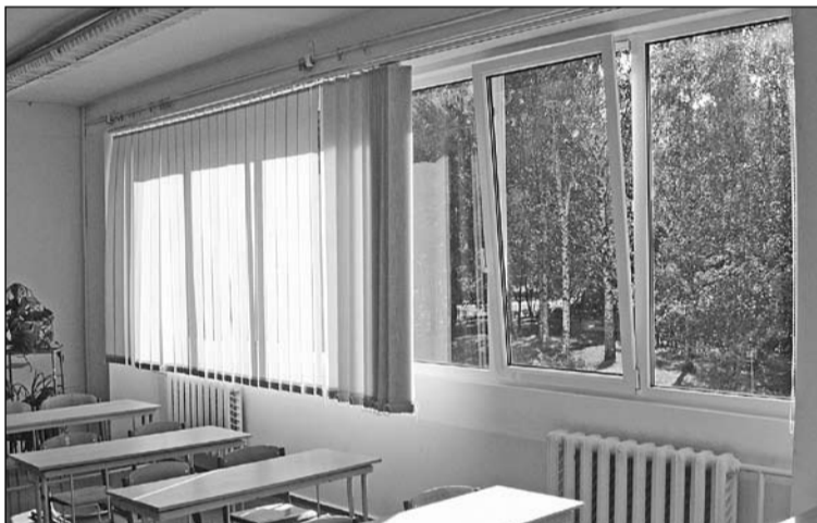
Olaines 2. vidusskolai nomainīti logi un uzlikta jauna žalūzijas.

2007./2008. mācību gadā skolā mācās 680 skolēni, un 5 – 6 gadīgo bērnu sagatavošanas grupu apmeklē