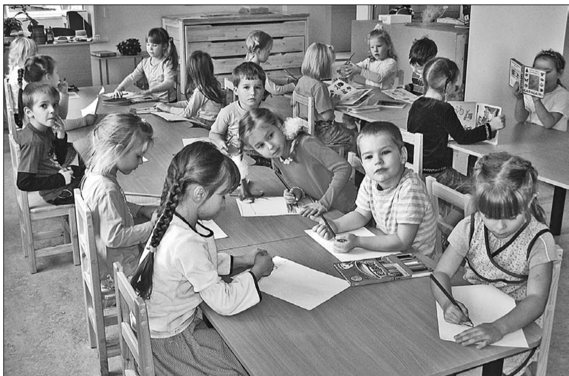
Pil "Zīle" audzēkņi apgūst iestādes filiāles telpas.

iepriecina gan pašvaldības vadību, gan iedzīvotājus, taču dome paliek modra un jau tagad domā par iespējamiem risinājumiem nākotnē, jo jautājums par rindu Olaines pil-