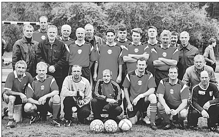
Olaines futbola veterānu kluba biedri.

3. vieta – Ilona Kolosova, Olaines 2. vidusskola (1;49,4);