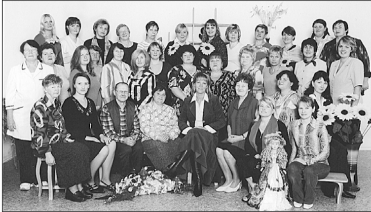
Pil “Zīle” kolektīvs.