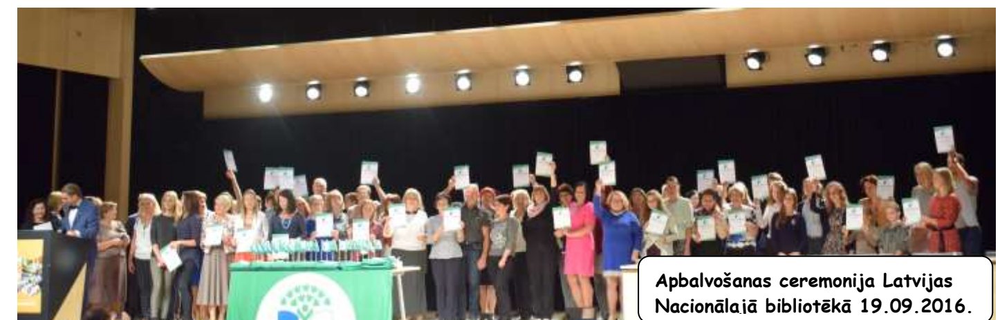
Apbalvošanas ceremonija Latvijas Nacionālajā bibliotēkā 19.09.2016.

Mūsu izvēlētā 2016./2017.mācību gada tēma - enerģija. Uzdevumi- sekmēt priekšstatus par enerģiju, tās nozīmi, iegūšanu, pārveidošanu, izmantošanu un par šo procesu sekām, rosināt taupīgi, efektīvi izmantot enerģiju.