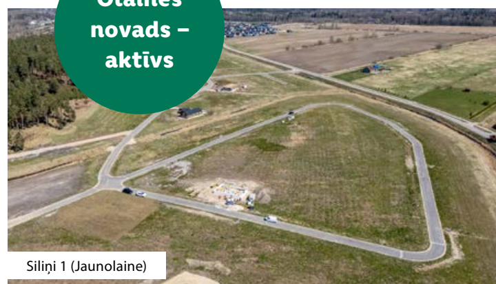
Siliņi 1 (Jaunolaine)