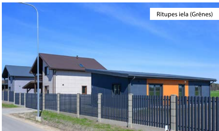
Rītupes iela (Grēnes)