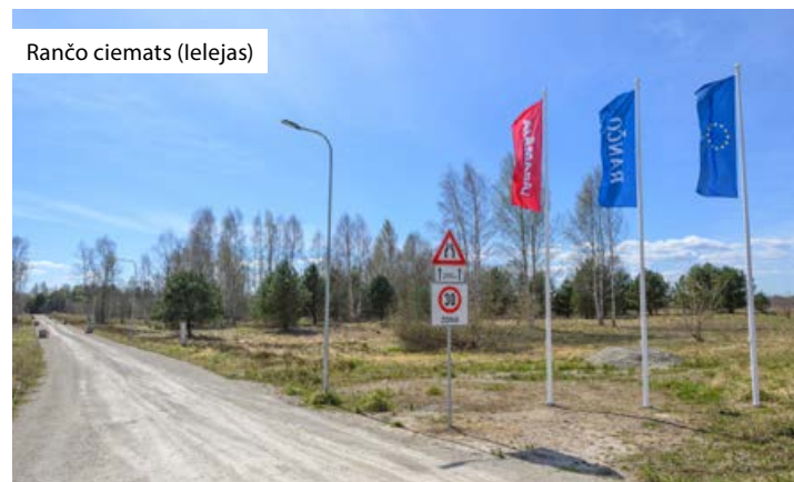
Rančo ciemats (Ielejas)

Kopumā šie projekti iezīmē Olaines novada attīstības virzienu – pakāpenisku, pārdomātu un uz kvalitatīvu dzīves vidi vērstu privātmāju apbūvi, kur līdzās mājokļiem tiek attīstīta arī nepieciešamā infrastruktūra un pakalpojumi. ●