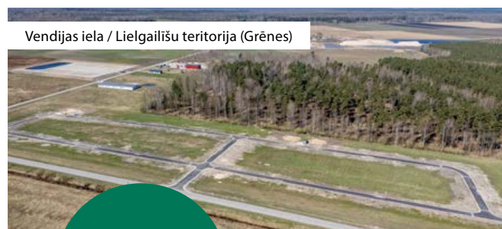
Vendijas iela / Lielgailiņu teritorija (Grēnes)

Novadā darbojas vairāki nekustamo īpašumu attīstītāji, kuru pieejas atšķiras, taču kopumā tās balstās uz līdzīgiem principiem – pārdomātu teritorijas plānojumu, infrastruktūras izbūvi un vienotas dzīves vides veidošanu. Viens no pieredzējušākajiem attīstītājiem ir Indars Leflers, kurš šajā jomā darbojas jau