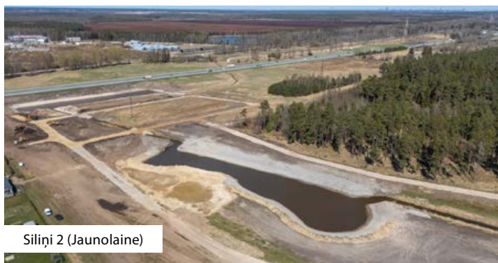
Siliņi 2 (Jaunolaine)