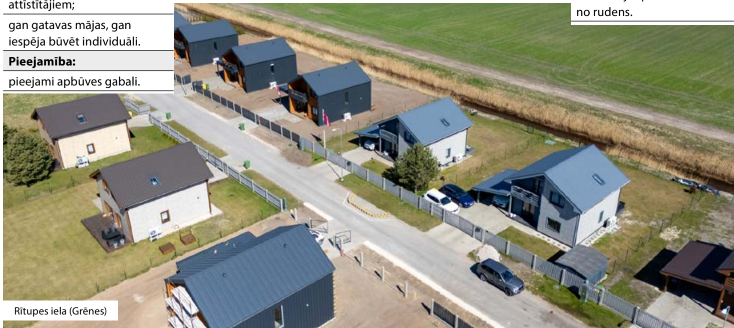
Rītupes iela (Grēnes)