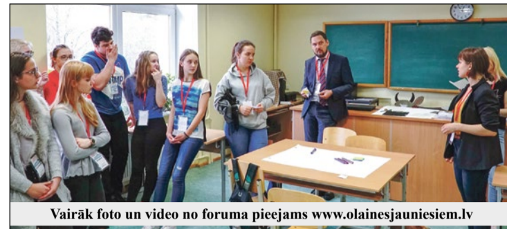
Vairāk foto un video no foruma pieejams www.olainesjauniesiem.lv

Projekts "Local Action Youth" tiek finansēts ar Eiropas Komisijas programmas "Erasmus+: Jaunatne darbībā" atbalstu; programmu Latvijā administrē Jaunatnes starptautisko programmu aģentūra. Šī publikācija atspoguļo vienīgi autora uzskatus, un Komisijai nevar uzlikt atbildību par tajā ietvertās informācijas jebkuru iespējamo izlietojumu.