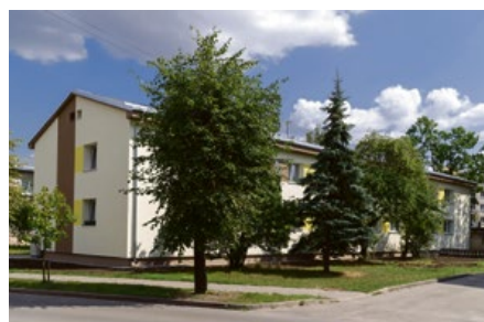
Renovēta māja Zemgales ielā 13

Olaines novadā pērn turpinājās daudzdzīvokļu dzīvojamo māju renovācija. Izmantojot jauno daudzdzīvokļu māju energoefektivitātes (DME) valsts atbalsta programmu, ko īsteno "Altum" ar Eiropas Savienības fondu finansējumu, renovācijas darbi 2018. gadā pilnībā pabeigti divās daudzdzīvokļu mājās – Kūdras ielā 3 un Zemgales ielā 13, savukārt vēl astoņās mājās pērn renovācijas projektu ietvaros sākti būvdarbi.