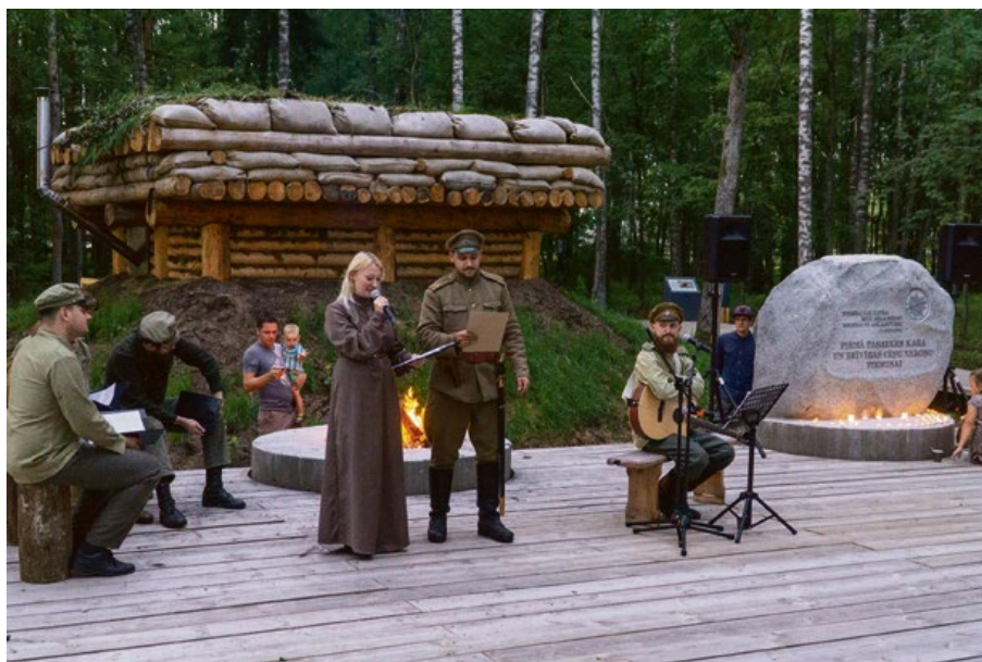
Atklāts Pirmā pasaules kara vēstures izziņas maršruts