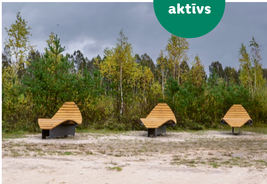
Labiekārtota teritorija Līdumu karjerā jeb Klīvēs