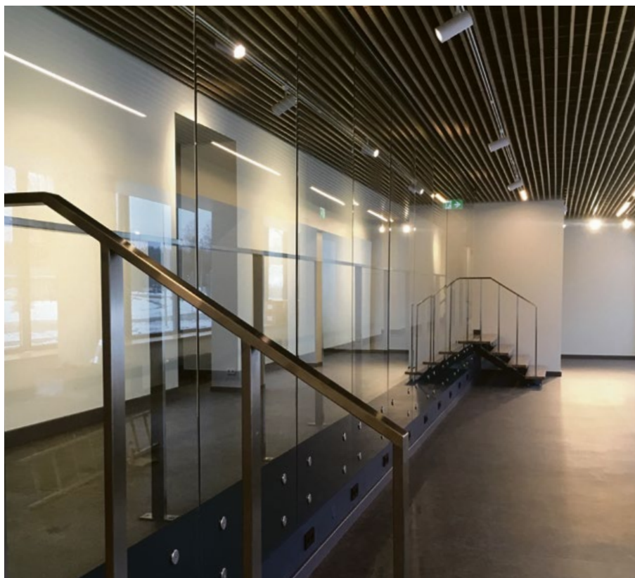
Olaines Vēstures un mākslas muzeja izveide

“(ie)dvesma” otrajai sezonai, divi Olaines novada jaunie uzņēmēji saņēmuši grantu 10 000 eiro apmērā.