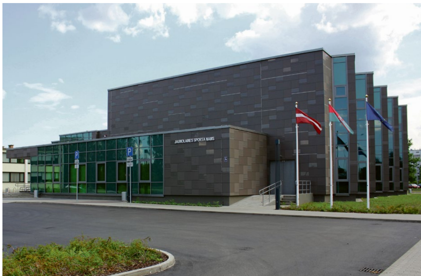
Uzcelts Jaunolaines Sporta nams

Olaines novadā pērn turpinājās daudzdzīvokļu dzīvojamo māju renovācija. Izmantojot jauno daudzdzīvokļu māju energoefektivitātes (DME) valsts atbalsta programmu, ko īsteno "Altum" ar Eiropas Savienības fondu finansējumu, renovācijas darbi 2018. gadā pilnībā pabeigti divās daudzdzīvokļu mājās – Kūdras ielā 3 un Zemgales ielā 13, savukārt vēl astoņās mājās pērn renovācijas projektu ietvaros sākti būvdarbi.