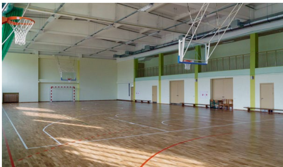
Olaines 2. vidusskolas sporta zālē veikti atjaunošanas remontdarbi

● Vairāk nekā 2000 bērnu un jauniešu Olaines novadā iesaistījušies "Olimpiskās dienas" aktivitātēs.