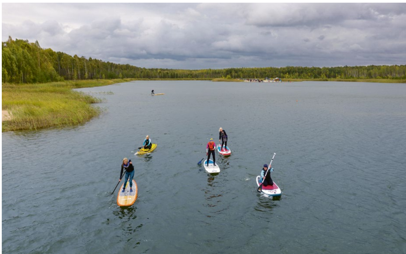
SUP sacensības Līduma karjerā

● Olainē jau ceturto gadu pēc kārtas norisinājās vērienīgie Latvijas velosvētki.