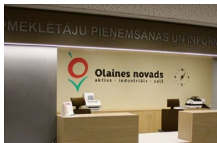
Apmeklētāju pieņemšanas un informācijas centra telpas

Olainē izveidots jauns vides objekts "Sākums", kas ir dāvana pilsētas iedzīvotājiem un viesiem Olaines dzimšanas dienā un Latvijas valsts simtgadē.