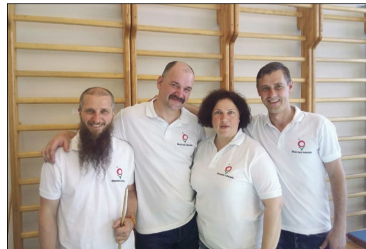
Sveicam Olaines novada komandu ar panākumiem!

Ceturto gadu pēc kārtas Pierīgas novadu sporta spēļu novusa turnīrā pirmo vietu izcīnījusi Babītes novada komanda. Tāpat kā pērn nākamās divas vietas kopvērtējumā ieņēma Ķekavas un Mālpils novusa meistari. Olaines novada spēlētāji šoreiz palika uzreiz aiz godalgotā trijnieka.