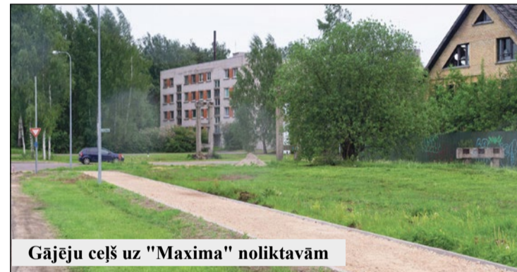
Gājēju ceļš uz "Maxima" noliktavām