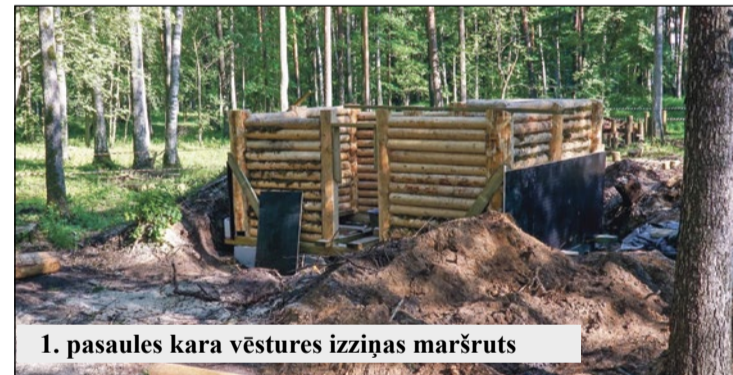
1. pasaules kara vēstures izziņas maršruts

ielai, tādējādi savienojot Jelgavas ielu, Celtnieku ielu un Ziemeļaustrumu apvedceļu, kas ved līdz "Maxima" noliktavām. Celiņi būs nodrošināti arī ar gājēju pārejām un apgaismojumu.