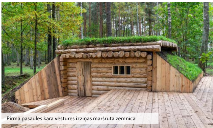
Pirmā pasaules kara vēstures izziņas maršruta zemnīca

aizsargātie satiksmes dalībnieki (gājēji, riteņbraucēji, skrituļotāji, nūjotāji un citi), mērojot ceļu no Olaines pilsētas līdz iecienītajai atpūtas vietai – Līdumu karjeram –, droši pa asfaltētu celiņu var nokļūt galamērķī.