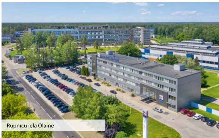
Rūpnicu iela Olainē

■ Šogad tika izbūvēts gājēju un velosipēdistu celiņa turpinājums jau esošajam celiņam uz Līdumu karjeru. Tas nozīmē, ka tagad mazāk