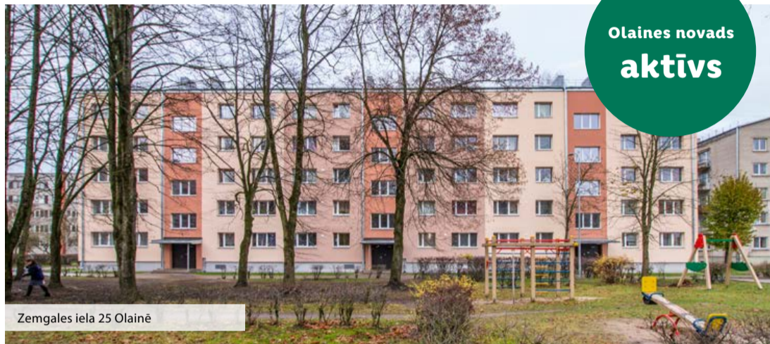
Zemgales iela 25 Olainē

Pirmā projekta realizācijas rezultātā ieguvēji ir industriālais parks "Nordic Industrial Park" un SIA "Bona Fides". Kopējais AS "Olaines ūdens un siltums" ieguldījums šajā projektā ir 165 000 eiro. Savukārt, realizējot ūdensapgādes un sadzīves kanalizācijas tīklu izbūvi Rīgas ielā, Olainē, ieguvēji ir: attīstības teritorija Rīgas ielā 23 un uzņēmumi Rīgas ielā 21, 21B un 21C.