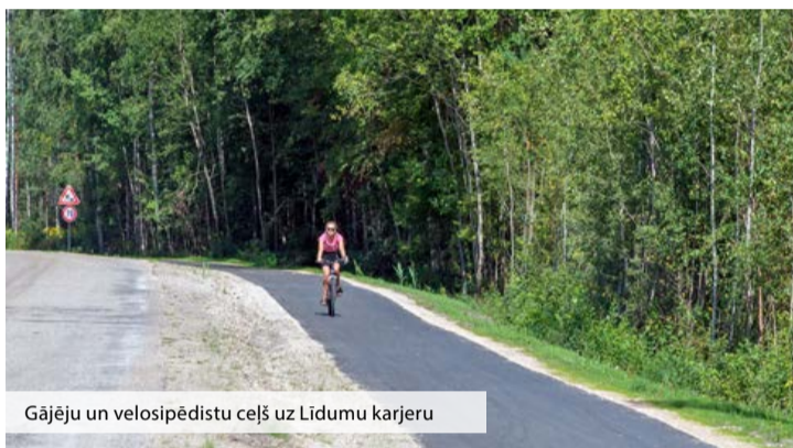
Gājēju un velosipēdistu ceļš uz Līdumu karjeru