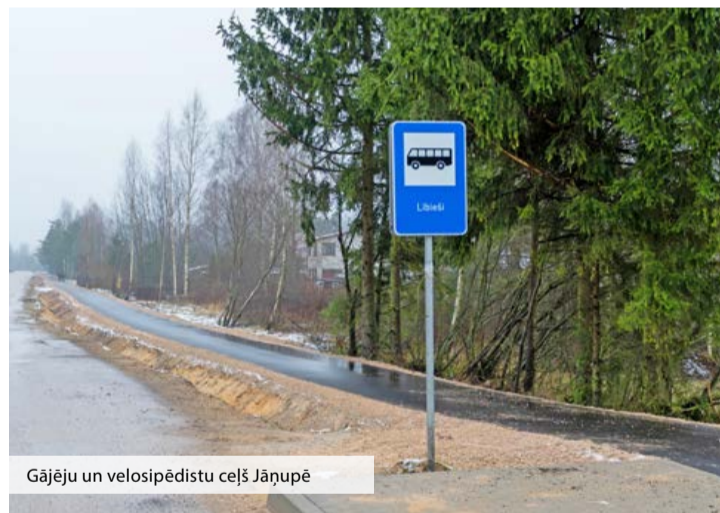
Gājēju un velosipēdistu ceļš Jāņupē

aizsardzības un reģionālās attīstības ministrijas piešķirto naudas balvu 30 000 eiro apmērā, kas iegūta konkursā “Ģimenei draudzīgākā pašvaldība” 2018. gadā. Objektā izbūvēts apgaismojums un uzstādīta videonovērošanas kamera.