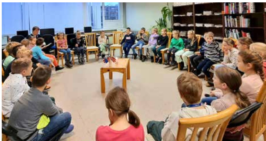
Pasākums un kopīgs lasījums rīta stundā "Daba ziemeļvalstīs"