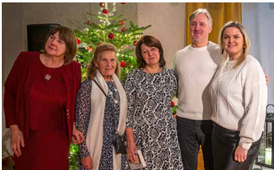
Muzikāls vakars kopā ar Latvijas Nacionālā teātra aktieri Juri Hiršu