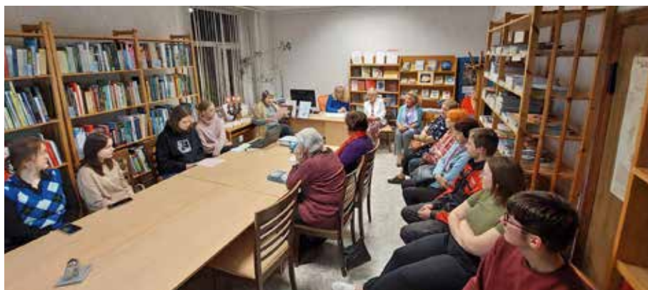
Olaines bibliotēka, lasījums krēslas stundā "Ziemeļvalstu literatūras nedēļas" ietvaros