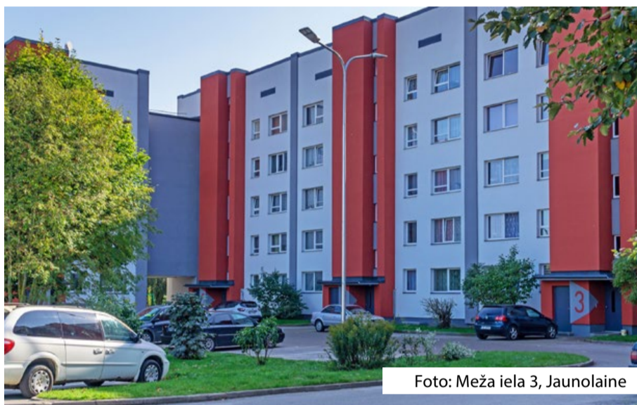
Foto: Meža iela 3, Jaunolaine

asfalta seguma ieklāšanas darbus Stacijas ielā, Pļavu ielā, Indrānu ielā un Vāveru ielā, Pārolainē, par kopējo summu 79 223,93 eiro (pašvaldības līdzfinansējums – 42 947,31 eiro). Tuvojoties jaunam budžeta plānošanas gadam, vēlamies iedrošināt iedzīvotājus un biedrības aktīvi izmantot šo pašvaldības atbalstu. Vidēji tiek līdzfinansēti aptuveni 20 projekti gadā.